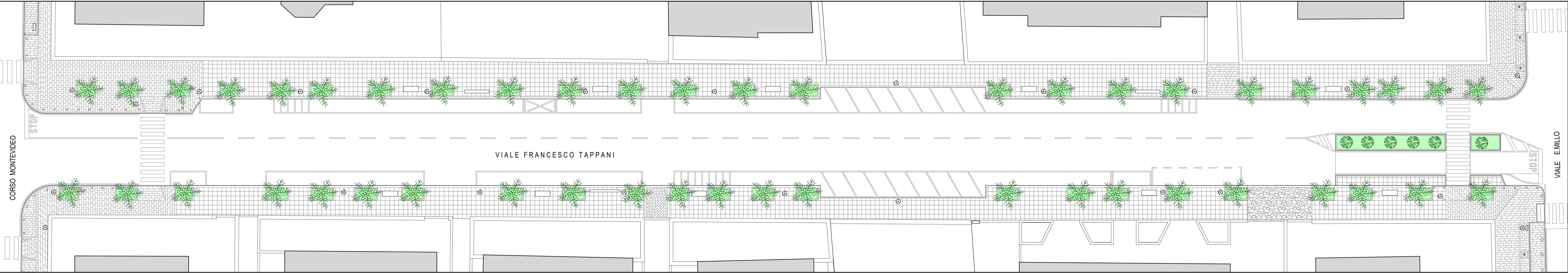
VIALE FRANCESCO TAPPANI - TRATTO 01