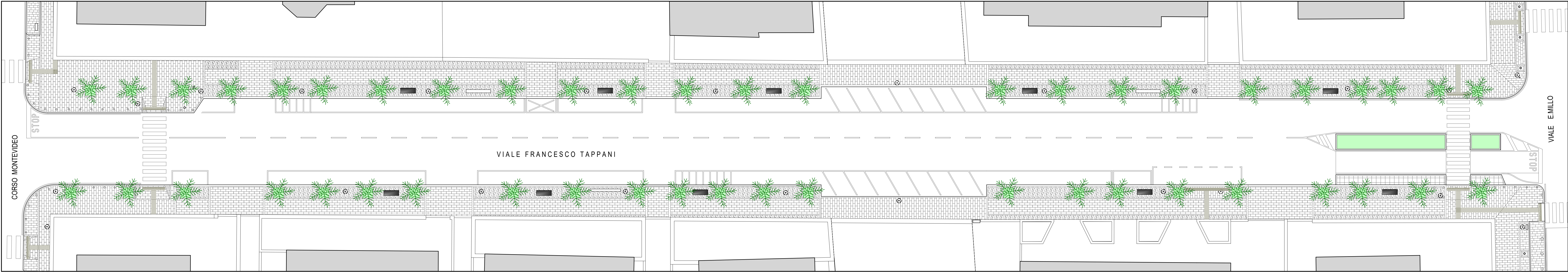
VIALE FRANCESCO TAPPANI - TRATTO 01